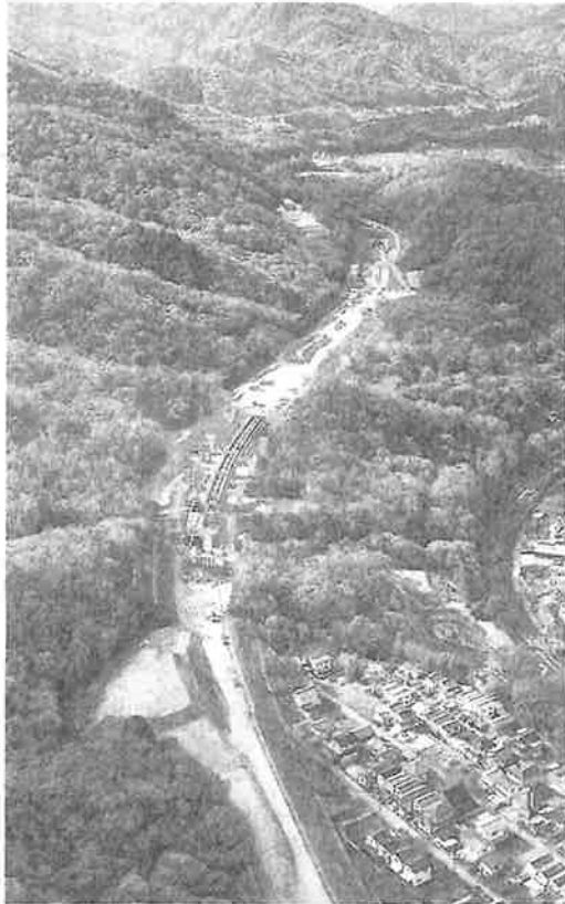
広島市安芸区上瀬野町付近の東広島・安芸バイパスの建設現場。瀬野川公園（奥右）の下では久井原トンネルの工事が進む