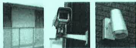
窓シャッター 防犯カメラ 人感センサーライト