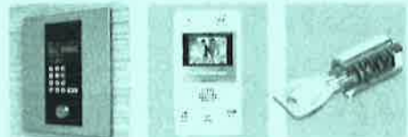
カメラ付オートロックシステム/テンキー モニター付きインターフォン ディンプルキー